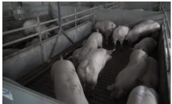
V16: 100 kg, 12 Schweine, natürlicher Beleuchtung, steiler Winkel

*Den Teilnehmern wurden farbige Videos gezeigt. Die Screenshots wurden nachträglich komprimiert und im Schwarz-Weiß-Modus dargestellt. Durch diese Komprimierung kann der Eindruck entstehen, dass die Videos verschwommen sind.