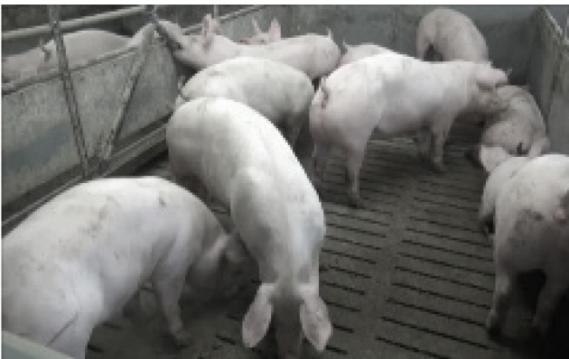
V3: 65 kg, 10 Schweine, künstliche Beleuchtung, flacher Winkel