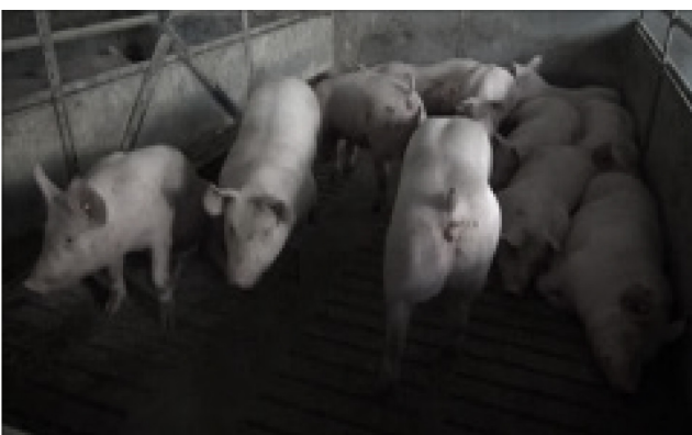
V7: 65 kg, 12 Schweine, natürlicher Beleuchtung, flacher Winkel