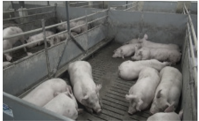
V12: 100 kg, 10 Schweine, künstliche Beleuchtung, steiler Winkel