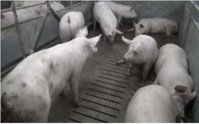
V9: 100 kg, 8 Schweine, künstliche Beleuchtung, flacher Winkel