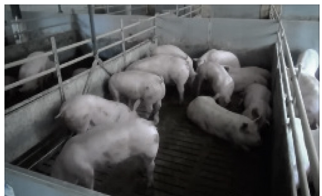
V8: 65 kg, 12 Schweine, natürlicher Beleuchtung, steiler Winkel