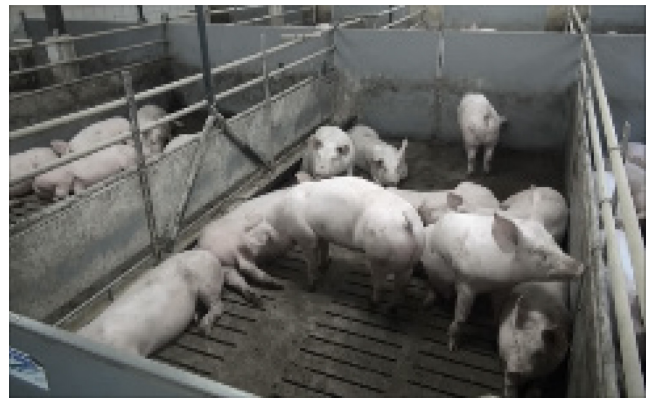
V4: 65 kg, 10 Schweine, künstliche Beleuchtung, steiler Winkel