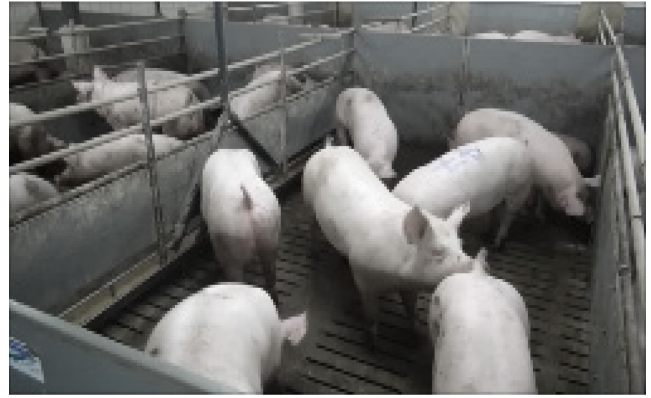
V10: 100 kg, 8 Schweine, künstliche Beleuchtung, steiler Winkel