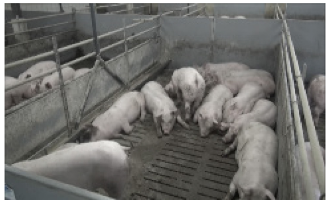
V6: 65 kg, 12 Schweine, künstliche Beleuchtung, steiler Winkel