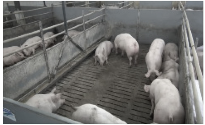
V2: 65 kg, 8 Schweine, künstliche Beleuchtung, steiler Winkel