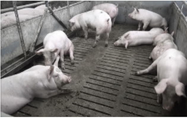
V1: 65 kg, 8 Schweine, künstliche Beleuchtung, flacher Winkel