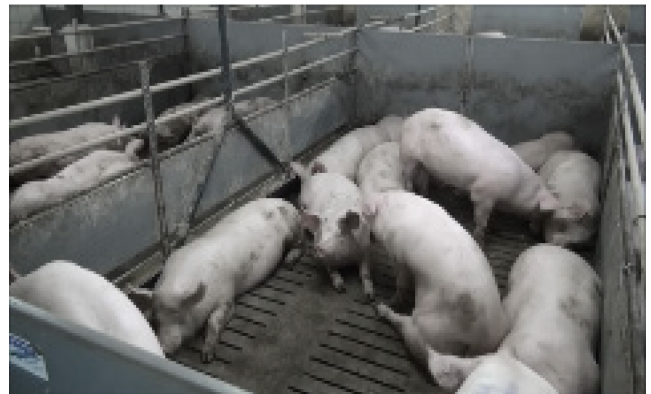
V14: 100 kg, 12 Schweine, künstliche Beleuchtung, steiler Winkel