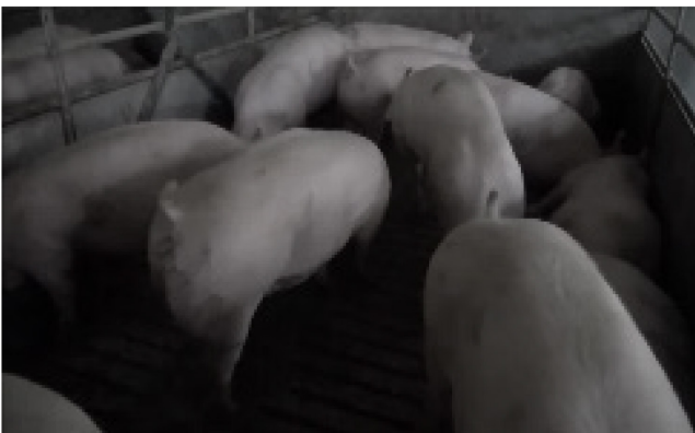
V15: 100 kg, 12 Schweine, natürlicher Beleuchtung, flacher Winkel