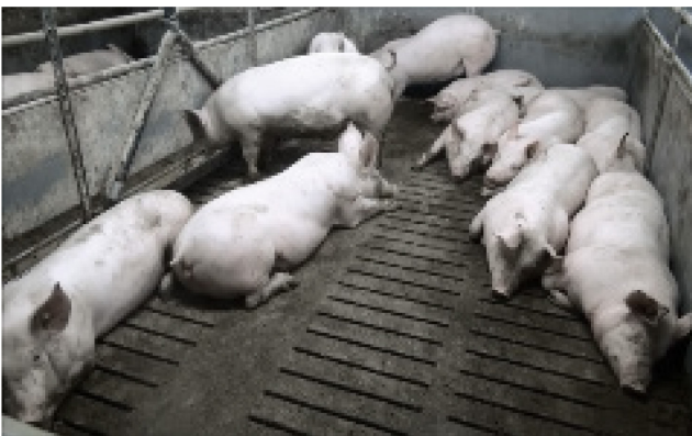
V5: 65 kg, 12 Schweine, künstliche Beleuchtung, flacher Winkel