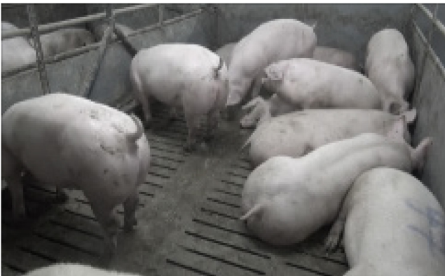
V13: 100 kg, 12 Schweine, künstliche Beleuchtung, flacher Winkel