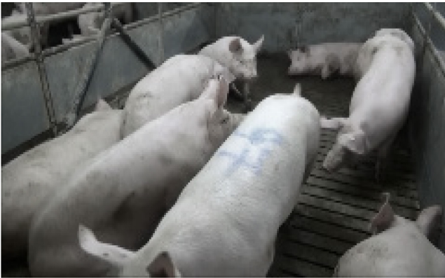
V11: 100 kg, 10 Schweine, künstliche Beleuchtung, flacher Winkel