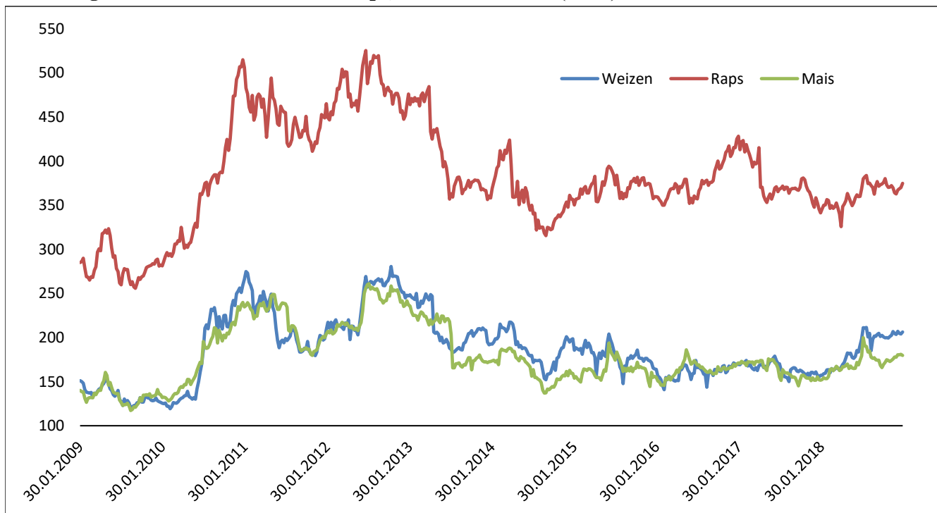
Abbildung 1. Matif-Börsenkurse für Raps, Weizen und Mais (in €/t)

Der Maiskontrakt an der Chicago Mercantile Exchange (CME) ist von 3,52 US$/bushel im Januar 2018 auf zuletzt etwa 3,80 US$/bushel angestiegen, während für die Sojabohne ein Preisverfall von 9,67 US$/bushel auf 9,16 US$/bushel verzeichnet worden ist. Der Preisverlauf der Sojabohne dürfte vor allem auf den Handelskonflikt zwischen den USA und China zurückzuführen sein. Im Juni verhängte China einen Importzoll von 25 % auf Sojabohnen aus den USA. Dies hatte zur Folge, dass sich die chinesische Nachfrage auf den südamerikanischen Sojabohnenmarkt konzentriert hat, während der Rest der Welt seinen Nachfragebedarf vor allem in den USA gedeckt hat. Netto resultierte die genannte Handelspolitik jedoch in einem Verlust von Exportanteilen der USA und einem Aufbau von Lagerbeständen in Rekordhöhe. Im Juli notierte die Sojabohne an der CME zwischenzeitlich bei 8,14 US$/bushel, was dem niedrigsten Preis seit 2008 entspricht.