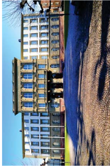
Hauptgebäude der Justus-Liebig-Universität Giessen.

Justus-Liebig-Universität Giessen Hauptgebäude Ludwigstr. 23 35390 Giessen