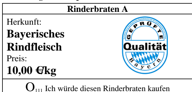
Abbildung 3. Beispiel für ein Choice-Set

Eine Nichtauswahl-Möglichkeit (no choice option) bestand nicht und den Befragten wurden vorab keine Informationen zu den Zeichen gegeben. Abbildung 3 zeigt exemplarisch ein Choice Set, wie es den Befragten jeweils vier Mal vorgelegt wurde.