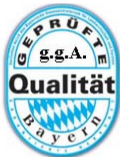
Abbildung 4. Mögliche Modifikationen des Zeichens Geprüfte Qualität-Bayern

Auf der anderen Seite besteht für eine Vielzahl von Erzeugnissen nicht die Möglichkeit der Anmeldung einer g.U. bzw. g.g.A., weil diese nicht die Kriterien der Verordnung (EG) NR. 510/06 erfüllen. Für diese Erzeugnisse sollten die staatlichen Herkunfts- und Qualitätszeichen weiter als Kennzeichnungsalternative angeboten werden bzw. weiter bestehen dürfen, da sie zur Förderung der Qualitätsproduktion von Lebensmitteln mit geringerem Differenzierungspotential beitragen, wie auch diese Studie belegt. Hierfür sollten sich die staatlichen Institutionen und Marketingeinrichtungen der Länder stärker als bisher