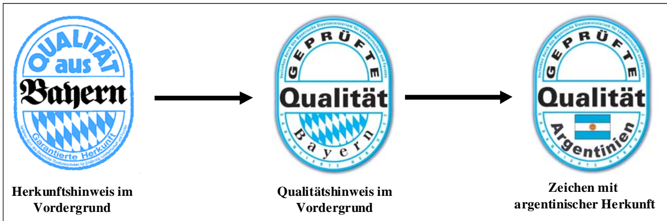
Abbildung 1. Modifikation des Logos des bayerischen Qualitätsprogramms